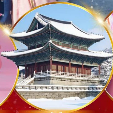
พระราชวังเคียงบกกรุง