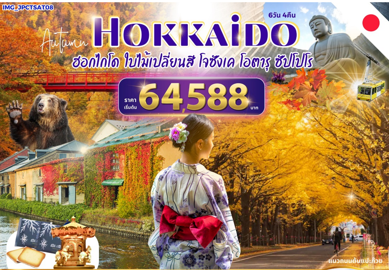
แนวถนนต้นแปะก๊วย

สัมผัสใบไม้เปลี่ยนสีโรแมนติกที่ฮอกไกโด ชมความน่ารักของหมีภูเขาไฟ ขึ้นกระเช้าภูเขาไฟซุซุ พลาดไม้ไผ่ เซคอินคยองโอตารุ นาฬิกาไอน้ำ พิพิธภัณฑ์กล่องดนตรี โรงงานช็อกโกแลต สักการะศาลเจ้าฮอกไกโด สะพานแขวนฟุตะมิ มิตซุยเอ้าเลกซัปโปโร