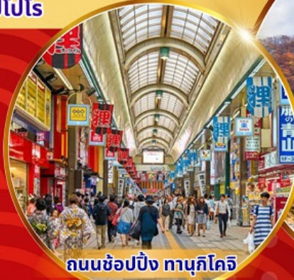
ถนนซัปโปโร ทานุกิโจจิ