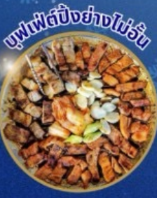
บุฟเฟ่ต์ปิ้งย่างไม่วัน