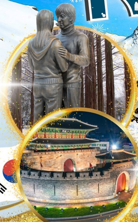
ป้อมฮวาซอง