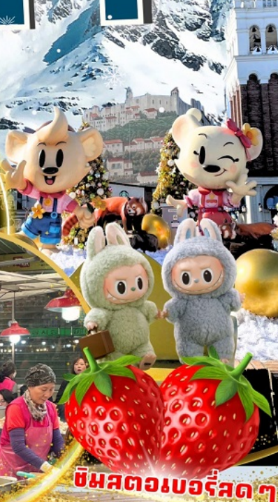
ตลาดกวางจ็อง