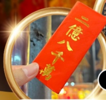
ยืมเงินเจ้าแม่กวนอิม