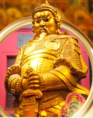
วัดเซ่งเตง

• วัดเจ้าแม่กวนอิมสองย่า • นั่งรถรางพิศโฉม • อ่าวรีพัลส์เบย์