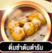
ต้มซ่าต้มตำรับ