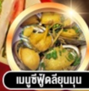
เมนูซีฟู้ดลิ้นจี่