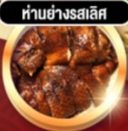
ทำนองรสเลิศ