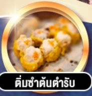
ต้มซ่าต้นตำรับ