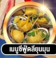
เมนูซีฟู้ดลิ้นยุบนุ่ม