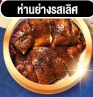
ห่านย่างรสเลิศ