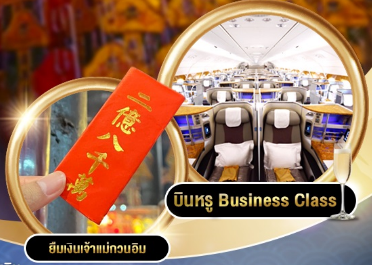
บินหรู Business Class