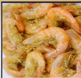
กุ้งทอดกระเทียม