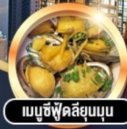
เมนูซีฟู้ดลิ้นขุน