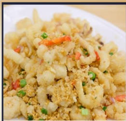
หมึกทอดกระเทียม