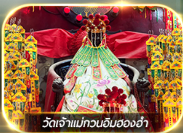
วัดเจ้าแม่กวนอิมสองอ้า