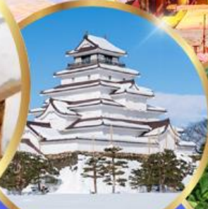
ปราสาทสิรุกะ