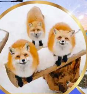
หมู่บ้านจิ้งจอก ซาโอะ