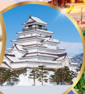
ปราสาทสิรุกะ