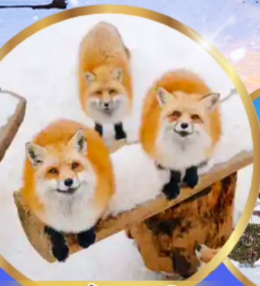
หมู่บ้านจิ้งจอก ซาโอะ