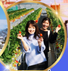
บุฟเฟต์ สตอเบอร์รี่ เก็บสดจากต้น