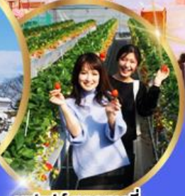
บุฟเฟต์ สตอเบอร์รี่ เก็บสดจากต้น