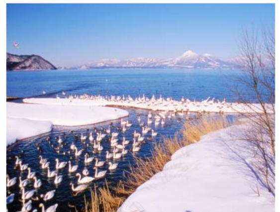
ทะเลสาบอินาวะชิโร Inawashiro-ko