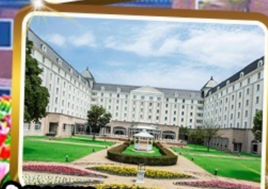
Win Hotel Nikko Huis Ten Bosch ★★★★★