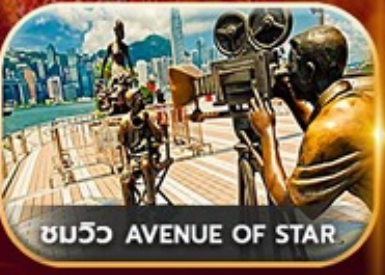
ชมวิว AVENUE OF STAR