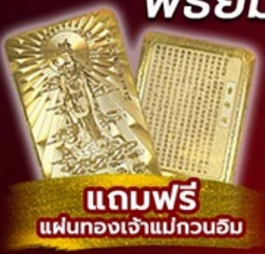
แถมฟรี แผ่นทองเจ้าแม่กวนอิม