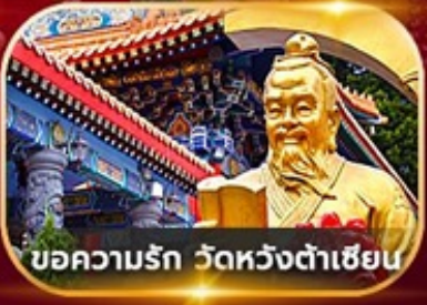
ขอความรัก วัดหวังต้าเซียน