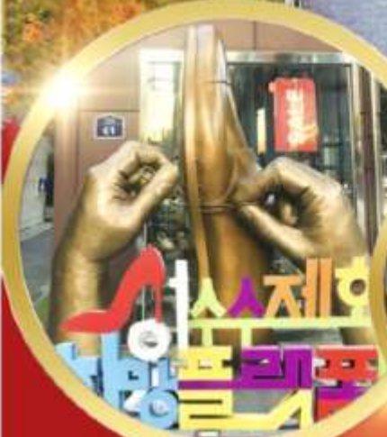
ซองชุง วอร์ดกึงสตรีค