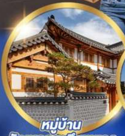
หมู่บ้าน

• ซุปป์องแควออร์กังสตรีท • ซุปป์ตลาดเมียงดง