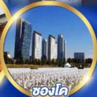
ชองโด Central park