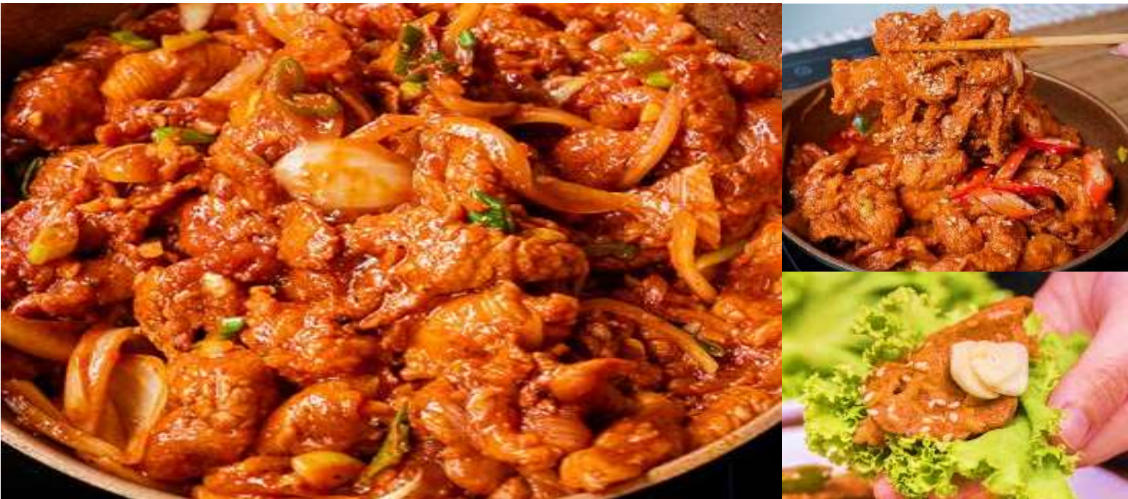
พร้อมข้าวสวยร้อน และเครื่องเคียงต่าง ๆ

กลางวัน บริการอาหารกลางวัน ณ ภัตตาคาร เมนู หมูผัดซอสเกาหลี เป็นหนึ่งในเมนูที่รู้จักกันดีที่ใช้วัตถุดิบชั้นดี หมักในซอสพริกตำรับแท้ของเกาหลี รสชาติเผ็ดนิด หวานหน่อย รับประทานคู่กับข้าวสวยร้อน ๆ หรือวางหมulgบนผักสด พร้อมด้วยเครื่องเคียงต่าง ๆ ห่อเป็นคำรับประทานได้ตามใจชอบ