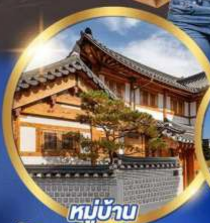
หมู่บ้าน วัฒนธรรมอินยอง