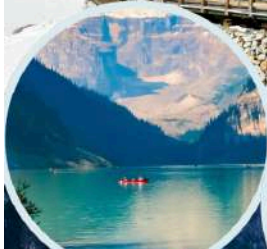
ทะเลสาบเตี๋ยซี