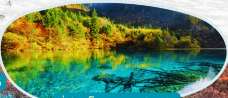
จิวจ้ายโกว รวมรถส่วนตัว