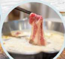
เมนูพิเศษ สุกี้หม่าล่า