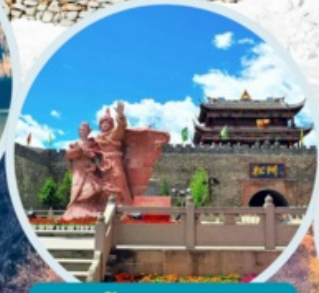
เมืองโบราณซงพาน