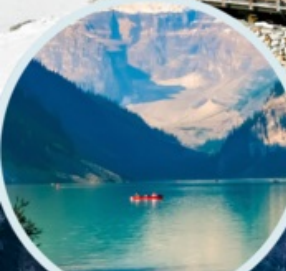
ทะเลสาบเต๋ยซี