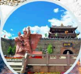
เมืองโบราณซงพาน