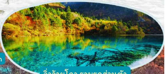
จิวจ้ายโกว รวมรถส่วนตัว