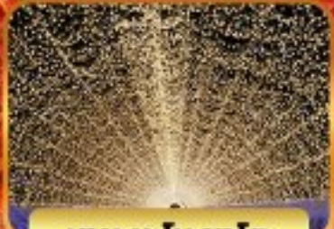
บาระนะโนะซาโตะ