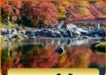
หุบเขาโคริงเค