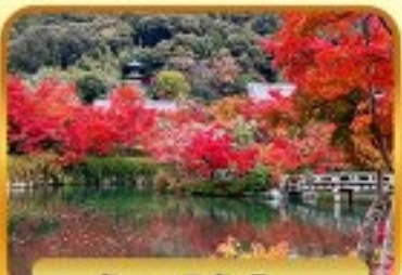
วัดเออิทังโด