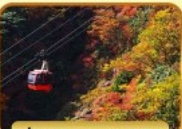
นั่งกระเช้าภูเขาโทโซไซ