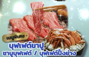
เมนูพิเศษ บุฟเฟ่ต์ชาบู ชาบูบุฟเฟ่ต์ / บุฟเฟ่ต์บิงย่าง