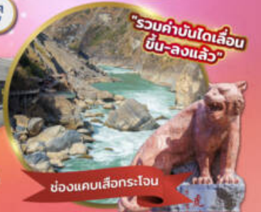
"รวมค่าบินได้เลื่อนขั้น-ลงแล้ว"