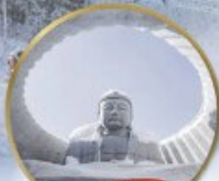
ฮิลล์ออฟ HILL OF BUDDHA