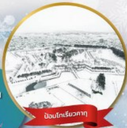
ป้อมโทริเยวคาคุ

หมู่บ้านนิงเกิลเกอเรส • สวนสัตว์อาซาฮิยาม่า • ชมขบวนพาเหรดเพนกวิน ตลาดเช้าฮาโกดาเตะ • ป้อมโทริเยวคาคุ • นั่งกระเช้าชมเมืองฮาโกดาเตะ ลานสกี • HILL OF BUDDHA • ไอตารุ • คลองไอตารุ • หมู่บ้านราเมน