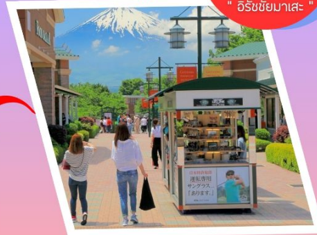
โกเทมบะ: เอาท์เลท