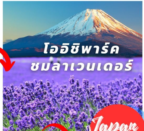
โออิชิพาร์ค ชมลาเวนเดอร์