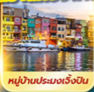
หมู่บ้านประมงเจิ้งปิน