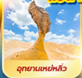
อุทยานเหย่หลิว

เที่ยวเต็ม!! ไม่มีวันอิสระ แช่น้ำแร่ในห้องพักส่วนตัว