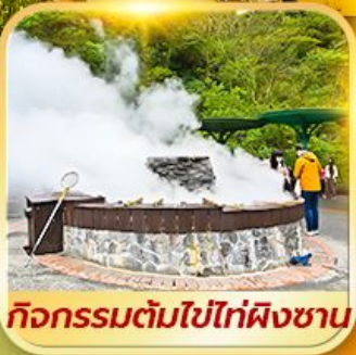
กิจกรรมต้มไข่ไท่ผิงซาน