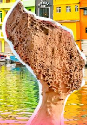
อุทยานเหย์หลิว