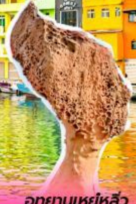
อุทยานเหย์หลิว