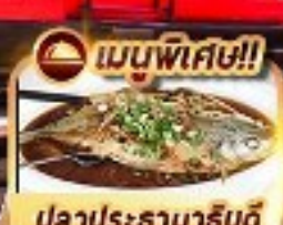
เมนูพิเศษ!! ปลาประธนาธินดี