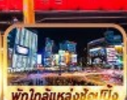
พิกโกไลแหล่งช้อปปิ้ง