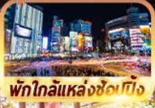
พักใกล้แหล่งช้อปปิ้ง