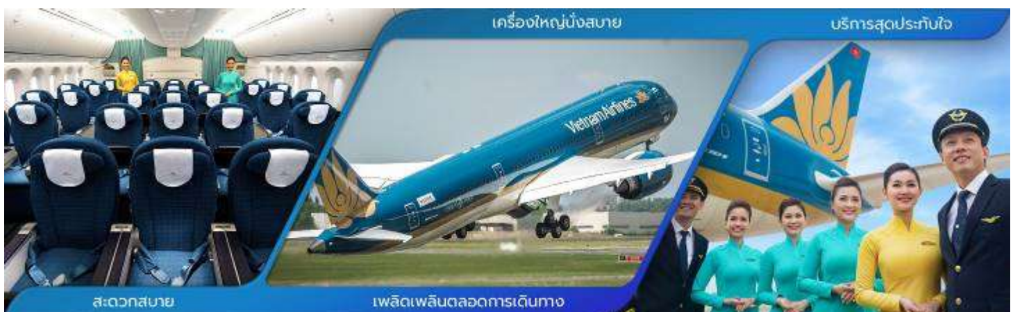
3 ภาพใช้เพื่อการโฆษณาเท่านั้น