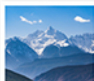
ภูเขาหินปะโพหม่าง