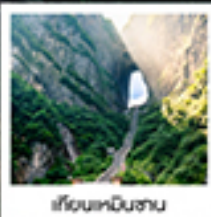
เวียงหนินชาน

ทรนดักกอน / สพานกั๋วไท่กว๋อ / เขาคิโยหนินชาน / เรือชิงไถ่ / ประตูล้อมรั้ว / ไร่ต๋องจิ้งจอกขาว / เขาคิโยหนินชาน สวนจอนหนิงเต๋อหลง / ทาฟวาทกราย / เมืองฟูหลงเจิน / ล่องเรือต๋องสำน้ำต๋อเจียง / เขามือเมืองโบราณฝ่งหวงยกน้ำดื่ม