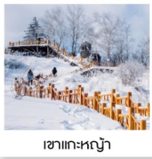
เขาแคะหญา

ฟรี!! ...ถุงมือ ผ้าพันคอ หมวก ท่านละ 1 ชุด