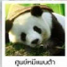
ตุนฝักปิ่นแพนด้า

อุทยานหวงหลง / อุทยานจิ่วจ้ายโกว / โรวี่ฟิงตงตุนฝักปิ่นแพนด้าตุนเจียงเซี่ย / สวนดอกไม้ทิ่กู / ระเบิดงาเก้ว / ถนนถนนเดินสูบฮี้กู / ถนนโบราณซันหนี่