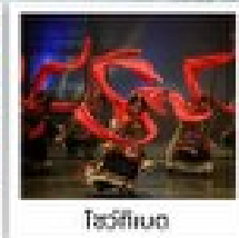
โรวี่ฟิงตง