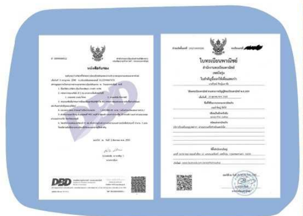
ตัวอย่างหนังสือจดทะเบียนบริษัท และ ใบทะเบียนพาณิชย์