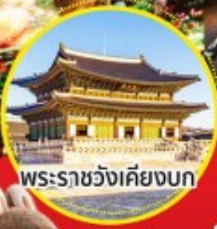
พระราชวังเคียงบก

จุดเช็คอินใหม่ สุดอลังการ!! ห้องสมุดของเกาหลี