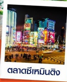
ตลาดซีหมินตง