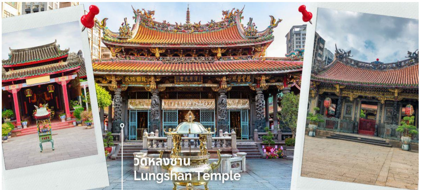
วัดหลงซาน Lungshan Temple

นำท่านสักการะ วัดหลงซาน เป็นหนึ่งในวัดที่เก่าแก่และมีชื่อเสียงมากที่สุดแห่งหนึ่งของเมืองไทเป ตั้งอยู่ในแถบย่านเมืองเก่า มีอายุเกือบ 300 ปี สร้างขึ้นโดยคนจีนชาวจีนผู้เจียนช่วงปีค.ศ. 1738 เพื่อเป็นสถานที่สักการะบูชาสิ่งศักดิ์สิทธิ์ตามความเชื่อของชาวจีน มีรูปแบบทางด้านสถาปัตยกรรมคล้ายกับวัดพุทธของจีน แต่มีลูกผสมของความเป็นไต้หวันเข้าไปด้วย ทำให้ที่นี่เป็นอีกหนึ่งแหล่งท่องเที่ยวที่ไม่ควรพลาด และภายในก็ยังมีเทพเจ้าองค์อื่นๆตามความเชื่อของชาวจีนอีกมากกว่า 100 องค์ด้านในมาจากทั้งศาสนาพุทธ เต๋า และขงจื้อ เช่น เจ้าแม่ทับทิม ที่เกี่ยวข้องกับการเดินทาง, เทพเจ้ากวนอู เรื่องความซื่อสัตย์และหน้าที่การงาน และเทพยเว้วเหล่า หรือ ผู้เฒ่าจันทรา ที่เชื่อกันว่าเป็นเทพผู้ก่อด้ายแดงให้สมหวังด้านความรัก