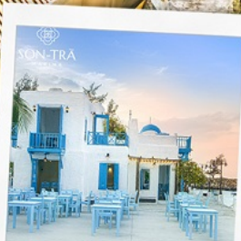
ซานตารีน่ากาแฟ