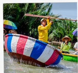
เรือกระดิง