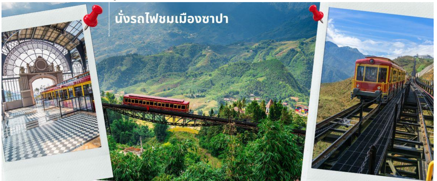
นั่งรถไฟชมเมืองซาปา

นำท่าน นั่งรถไฟชมเมืองซาปา (รวมค่ารถไฟชมเมือง) ท่านจะได้พบกับวิวทิวทัศน์ของเมืองซาปาที่เต็มไปด้วยความสดชื่น และสดกิ่นอายธรรมชาติ และยังตื่นตาไปด้วยวิวกุเอา และนาขั้นบันได ที่มีชื่อเสียงของเมืองซาปาอีกด้วย ความยาวประมาณ 2 กิโลเมตร โดยใช้เวลาประมาณ 20 นาทีเพื่อไปสู่สถานีขึ้นกระเช้าที่จะนำท่านขึ้นสู่ยอดเขาฟานซีปัน