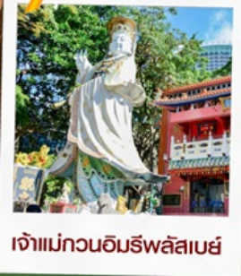
เจ้าแม่กวนอิมรพหลัสเบย์

23 กุมภาพันธ์ 2568 วันยืมเงินเจ้าแม่กวนอิม วัดสองอำเภอ