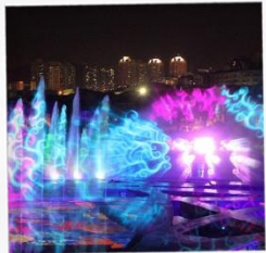
โชว์ม่านน้ำสามมิติ OCT BAY WATER SHOW