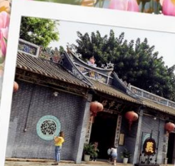
วัดกวนอูเซินเจิ้น