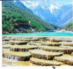
ทะเลสาบธารน้ำขาว รวมรถแท็กซี่