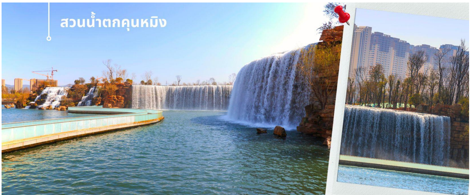
สวนน้ำตกคุณหมิง

นำท่านเดินทางสู่ สวนน้ำตกคุณหมิง เป็นสวนสาธารณะใจกลางเมืองคุณหมิง ถือเป็นสถานที่ท่องเที่ยวแห่งใหม่และเป็นที่พักผ่อนหย่อนใจยอดฮิตของชาวเมืองคุณหมิง ที่สร้างขึ้นด้วยฝีมือมนุษย์ น้ำตกแห่งนี้เป็นส่วนหนึ่งของโครงการผันน้ำจากแม่น้ำหนู่หลาน ให้เข้าสู่ทะเลสาบเตียนซี น้ำตกแห่งนี้มีความสูง 12.5 เมตร ยาว 400 เมตร ใช้เวลาสร้างเกือบ 3 ปี