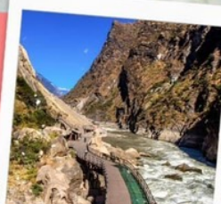
ช่องแคบเสือกระโจน รวมบันไดเลื่อน ขึ้น-ลง