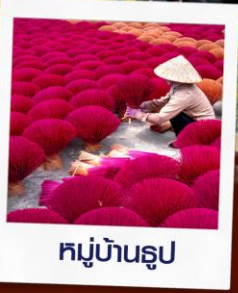
หมู่บ้านรูป