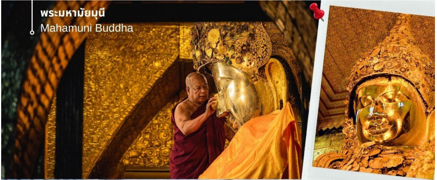
พระมหาามัยมูณี Mahamuni Buddha

เป็นพระพุทธรูปที่มีชีวิต ด้วยเหตุที่ได้รับประทานพร หรือบางตำนานก็กล่าวว่าได้รับประทานลมหายใจจากพระพุทธเจ้า จึงมีประเพณีล้างพระพักตร์ถวายโดยทุกเช้าในเวลาประมาณ 04.00 น. พระมหาเถระและสาธุชนทั่วไปที่ศรัทธาจะมาทำพิธีล้างพระพักตร์ด้วยน้ำอบน้ำหอมผสมทานาคาอย่างดี พร้อมกับใช้แปรงทองแปรงที่พระโอษฐ์เสมือนหนึ่งแปรงพระทนต์ถวายพระพุทธเจ้า ก่อนใช้ผ้าจากศรัทธาสาธุชนที่ถวายมาเช็ดจนแห้งสนิท แล้วนำกลับคืนแก่สาธุชนผู้นั้นไปบูชาต่อ พร้อมใช้พัดทองโบกถวายเป็นอันดี เสมือนหนึ่งได้อุปัฏฐากองค์สมเด็จพระสัมมาสัมพุทธเจ้าที่ยังทรงพระชนมชีพอยู่ พระมหาามัยมูณีมีอีกพระนามหนึ่งว่า "พระเนื้อนุ่ม" ซึ่งเกิดจากการปิดทองซ้ำแล้วซ้ำอีกจนเป็นรอยย่นตะปุ่มตะป่ำไปทั่วทั้งองค์ ซึ่งหากเอานิ้วกดลงไปจะรู้สึกได้ถึงความอ่อนนุ่มของทองคำเปลวที่ปิดทับซ้อนกันนับเป็นพัน ๆ หมื่น ๆ ชั้น สมควรแก่เวลานำท่านเดินทางกลับเข้าสู่ที่พัก