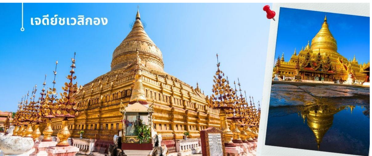
เจดีย์ชเวสิกอง

นำท่านนมัสการ เจดีย์ชเวสิกอง (1 ใน 5 มหาสถานอันศักดิ์สิทธิ์ของชาวพม่า) เชื่อกันว่าเจดีย์ชเวสิกอง เป็นที่ประดิษฐานพระสารีริกธาตุและพระทันตธาตุของพระโคตมพุทธเจ้า พระเจดีย์มีรูปทรงระฆังคว่ำมีการปิดประดับทองคำเปลว ฐานเจดีย์มีหลายชั้น เจดีย์เป็นทรงตัน ฐานระเบียงเจดีย์มีแผ่นภาพเคลือบปูนปั้นเล่าเรื่องในนิทานชาดก ที่ทางเข้าของเจดีย์มีรูปปั้นขนาดใหญ่ของผู้ปกป้องศาสนสถาน บริเวณโดยรอบล้อมด้วยวิหารและศาลเจ้าขนาดเล็ก นอกจากนี้ยังมีพระพุทธรูปสัมฤทธิ์สี่องค์ของพระพุทธเจ้าในภัทรกัปนี้ทั้งสี่ทิศ ที่ด้านนอกเขตเจดีย์มีวิหารนะ 37 ตน โดยมีท้าวสักกะหรือพระอินทร์เป็นหัวหน้านะ สร้างจากไม้แกะสลักอย่างประณีตตามแบบศิลปะพม่า บริเวณเจดีย์ชเวสิกอง ยังมีเสาหินที่จารึกเป็นภาษามอญในสมัยพระเจ้าจันชิต้า