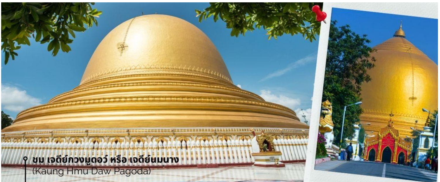
ชม เจดีย์กวงมุดอว์ หรือ เจดีย์นมนาง (Kaung Hmu Daw Pagoda)

นำท่านชม เจดีย์กวงมุดอว์ หรือ เจดีย์นมนาง (Kaung Hmu Daw Pagoda) เป็นเจดีย์พุทธขนาดใหญ่ ตั้งอยู่เขตชานเมืองทางตะวันตกเฉียงเหนือของชะไก้ โดยจำลองตามสัณเฑาะฐมาลีมหาเจดีย์ในประเทศศรีลังกา ฐานชั้นล่างสุดของเจดีย์ประดับด้วยนระและเทวดา 120 องค์ ล้อมรอบด้วยโคมหิน 802 ต้น ซึ่งแกะสลักพร้อมจารึกพุทธประวัติสามภาษาได้แก่ พม่า, มอญ และไท