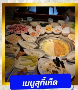
เมนูสุกั้เกิด