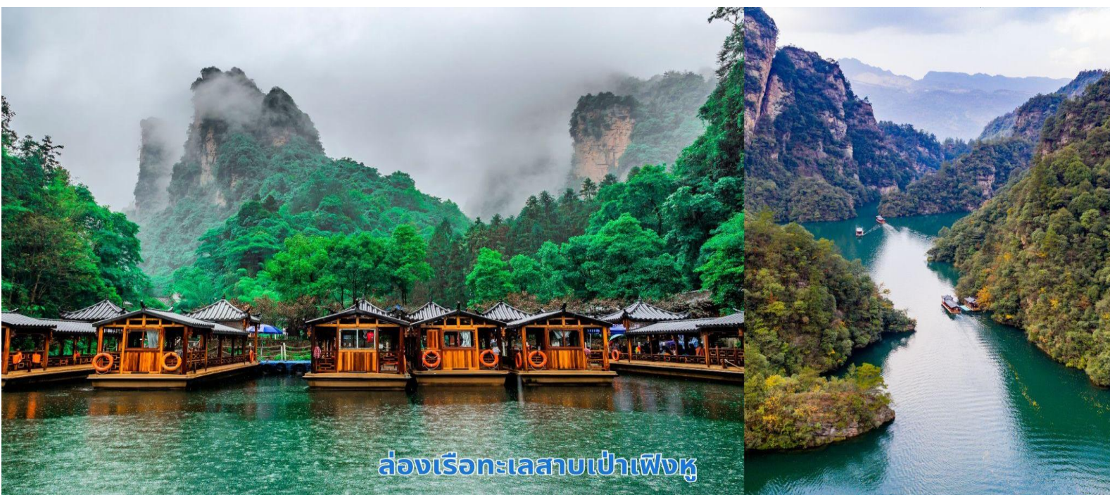
ล่องเรือทะเลสาบเป่าเฟิงหู

เช้า บริการอาหารเช้า ณ ห้องอาหารของโรงแรม นำท่านเพลิดเพลินไปกับการล่องเรือชมความงาม ทะเลสาบเป่าเฟิงหู (Baofeng Lake) ทะเลสาบที่สวยงาม ด้วยน้ำที่เป็นสีเขียวเข้มราวกับเนื้อหยกโอบล้อมด้วยภูเขาหินรูปทรงประหลาดแปลกตาต่าง ๆ มากมาย เป็นทะเลสาบบนที่สูง ที่หาชมได้ยาก ได้รับการขึ้นทะเบียนเป็นมรดกโลกทางธรรมชาติ ในปี ค.ศ. 1992