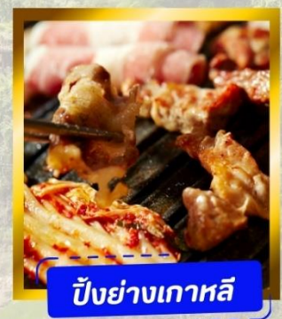
ปิ้งย่างเกาหลี