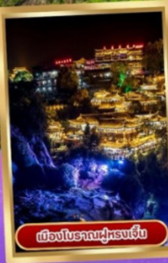
เมืองโบราณฝูหรงเจิ้น