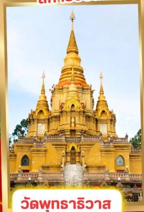
วัดพุทธาริวาส