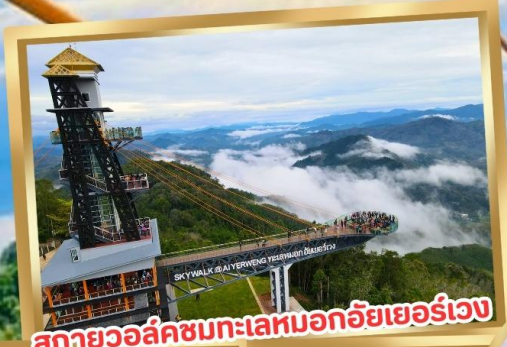
สกายวอล์คชมทะเลหมอกอัยเยอร์เวง

ร่วมโครงการ ลดหย่อนภาษี ลดสูงสุด 15,000.-