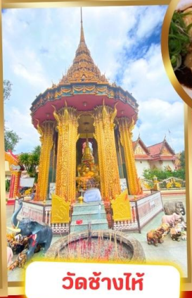
วัดช้างไห้