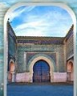
KASBAH OF MOULAY ISMAIL