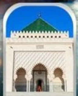
MOHAMMED V SQUARE