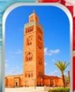
JEMAA EL-FNAA MARRAKESH