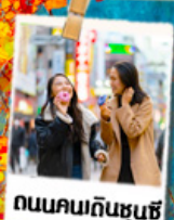
ถนนคนเดินฮุนชู่