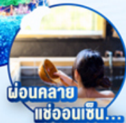
ผ่อนคลาย แช่ออนเซน...

ไฮไลท์!! ลานสกีทาล่า ยูซาว่า สวรรค์ของนักท่องเที่ยวกุหลาบ ตระการตา LED 6 ล้านดวง ชมงานประดับไฟ SAGAMIKO ILLUMINATION สักการะ หลวงพ่อโตโตบุทสึ พระพุทธรูปปางนั่งสมาธิที่สูงที่สุดอันดับสอง สักการะ วัดชิรินซัง ดารุมะ-จิ ต้นกำเนิดตุ๊กตาดารุมะของญี่ปุ่น เครื่องราง นำโชค