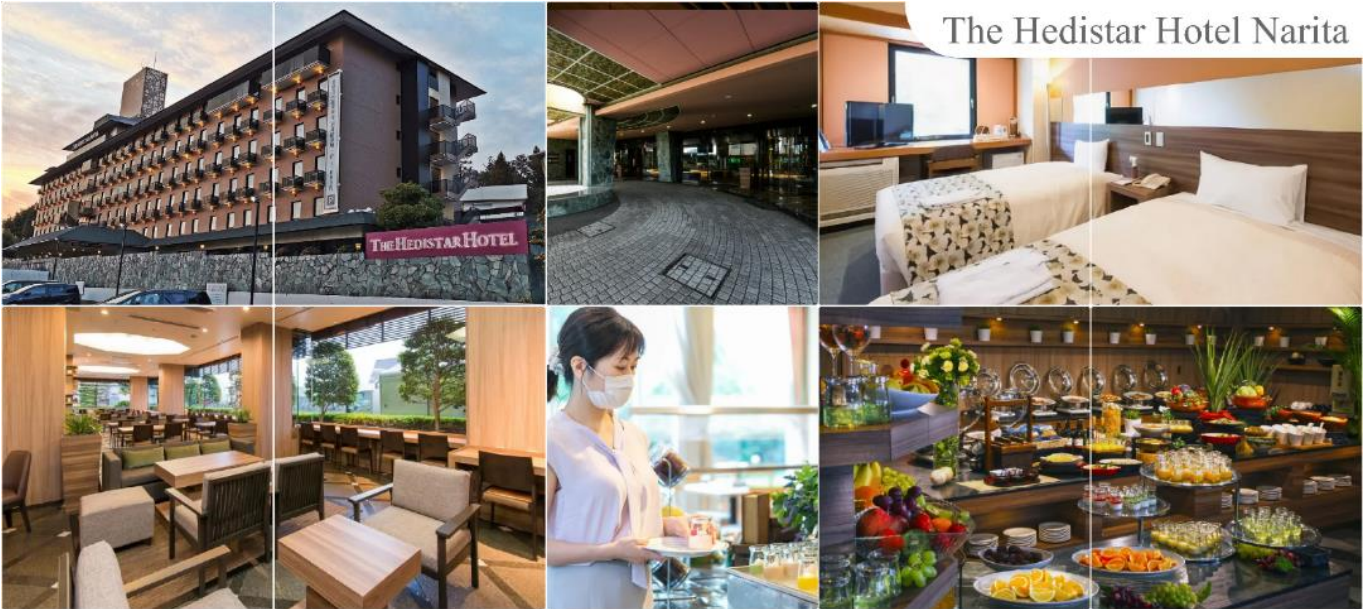
The Hedistar Hotel Narita

วันแรก ท่าอากาศยานนานาชาติดอนเมือง – ท่าอากาศยานนานาชาตินาริตะ – เมืองนาริตะ 07.30 น. พร้อมกันที่ ท่าอากาศยานนานาชาติ ดอนเมือง อาคาร 1 ผู้โดยสารชาวอกระหว่างประเทศ เคาน์เตอร์ สายการบินแอร์เอเชีย เอ็กซ์ เจ้าหน้าที่ของบริษัทฯ คอยให้การต้อนรับ และอำนวยความสะดวกในการเช็คอิน 10.55 น. เหมิรฟาสู่ ท่าอากาศยานนานาชาตินาริตะ เมืองนาริตะ ประเทศญี่ปุ่น โดยเที่ยวบินที่ XJ606 สายการบิน AIR ASIA X ใช้เครื่อง AIRBUS A330-300 จำนวน 377 ที่นั่ง จัดที่นั่งแบบ 3-3-3 (น้ำหนักกระเป๋า 20 กก./ท่าน หากต้องการซื้อน้ำหนักเพิ่ม ต้องเสียค่าใช้จ่าย) บริการอาหารและเครื่องดื่มบนเครื่อง(ราคาโปรโมชั่นไม่มีอาหารบนเครื่อง) 19.00 น. เดินทางถึง ท่าอากาศยานนานาชาตินาริตะ ประเทศญี่ปุ่น นำท่านผ่านขั้นตอนการตรวจคนเข้าเมืองและศุลกากร เรียบร้อยแล้ว (เวลาที่ญี่ปุ่น เร็วกว่าเมืองไทย 2 ชั่วโมง กรุณาปรับนาฬิกาของท่านเพื่อความสะดวกในการนัดหมายเวลา) ***สำคัญมาก!! ประเทศญี่ปุ่นไม่อนุญาตให้นำอาหารสด จำพวก เนื้อสัตว์ พืช ผัก ผลไม้ เข้าประเทศ หากฝ่าฝืนมีโทษปรับและจับ นำท่านสู่ เมืองนาริตะ (Narita) เมืองที่อยู่ห่างไปทางตะวันออกของกรุงโตเกียว 60 กิโลเมตร ตั้งอยู่ทางตอนเหนือของจังหวัดจิบะ มีแม่น้ำโทเนะกันแบ่งกับเมืองอิบารากิ มีพื้นที่ทั้งหมด 214 ตารางกิโลเมตร และประชากร 120,000 คนโดยประมาณ เมืองแห่งนี้อุดมสมบูรณ์ไปด้วยแหล่งน้ำและความเขียวขจีของต้นไม้ใหญ่ๆ นำท่านเข้าสู่ที่พัก (ใช้เวลาเดินทางประมาณ 15 - 20 นาที) (โดยรถบัสโรงแรม) พักที่ THE HEDISTAR HOTEL NARITA หรือระดับเดียวกัน