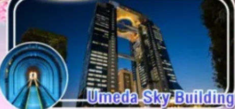
Umeda Sky Building