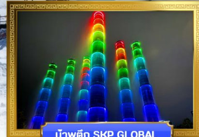
น้ำพุตึก SKP GLOBAL