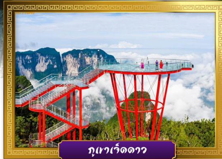
ภูเขาเว็ดดาว

✓ เดินเล่นถนนคนเดินหวงซิงลู่และซีปู้เจีย