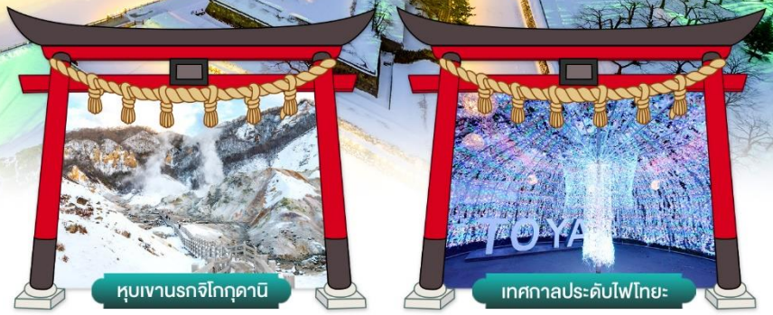
หุบเขานรกจิโกกุคานี