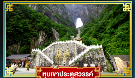
ทิวเขาประจูดสวรรค์