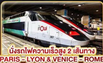
นั่งรถไฟความเร็วสูง 2 เส้นทาง PARIS - LYON & VENICE - ROME

📅 เดินทาง : 11-20 ก.พ. 68 / 15-24 มี.ค. 68 05-14 เม.ย. 68 / 29-08 พ.ค. 68