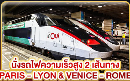
นั่งรถไฟความเร็วสูง 2 เส้นทาง PARIS - LYON & VENICE - ROME