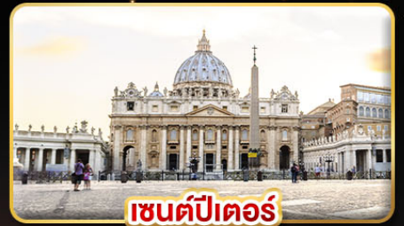
เซนต์ปีเตอร์