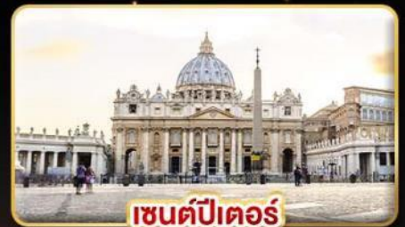
เซนต์ปีเตอร์