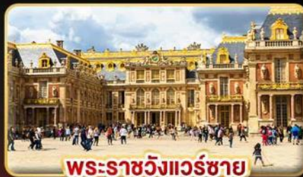
พระราชวังแวร์ซาย