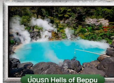
บ่อน้ำ Hells of Beppu