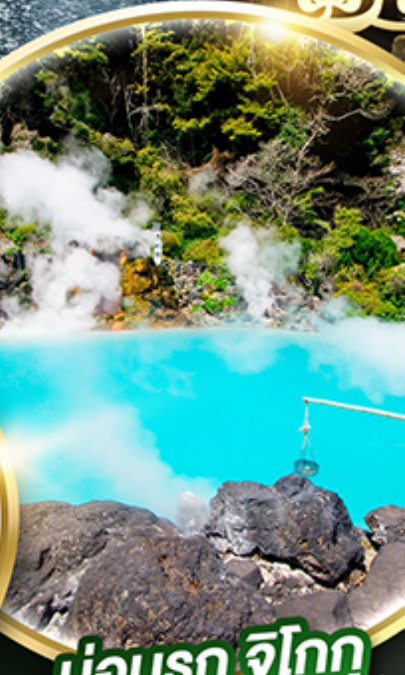
บ่อนรก จิโกกุ