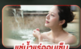
แช่น้ำแร่ออนเซ็น